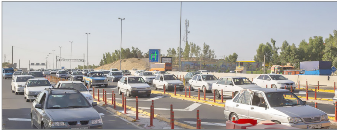
تسهیل در پرداخت عوارض الکترونیکی آزادراه ضروری است

پیش از این طبق قانون و در ایچه بودجه ۱۴۰۲، فرماندهی کل انتظامی جمهوری اسلامی ایران و شرکت‌های بیمه‌گر به منظور حمایت از الکترونیکی کردن آزادراه‌های کشور به اخذ مفاصاحساب بدهی‌های ناشی از عوارض آزادراهی از متقاضیان تعویض پلاک خودرو و خدمات بیمه شخص ثالث موظف شدند؛ این قانون در لایحه ۱۴۰۱ هم وجود داشت اما امسال این لایحه لغو شد و همین امر باعث شد که اجرای این طرح با کندی روبرو شود. او بیان کرد: اگر منابع و سرمایه‌های لازم برای اجرای این طرح تامین نشود نمی‌توان امید داشت که الکترونیکی شدن عوارض آزادراه‌ها به خوبی اجرایی شود چراکه بخش عمده‌ای از پروژه‌های آزادراهی توسط بخش خصوصی در حال اجرا است و اگر این طرح انجام نشود نمی‌توان