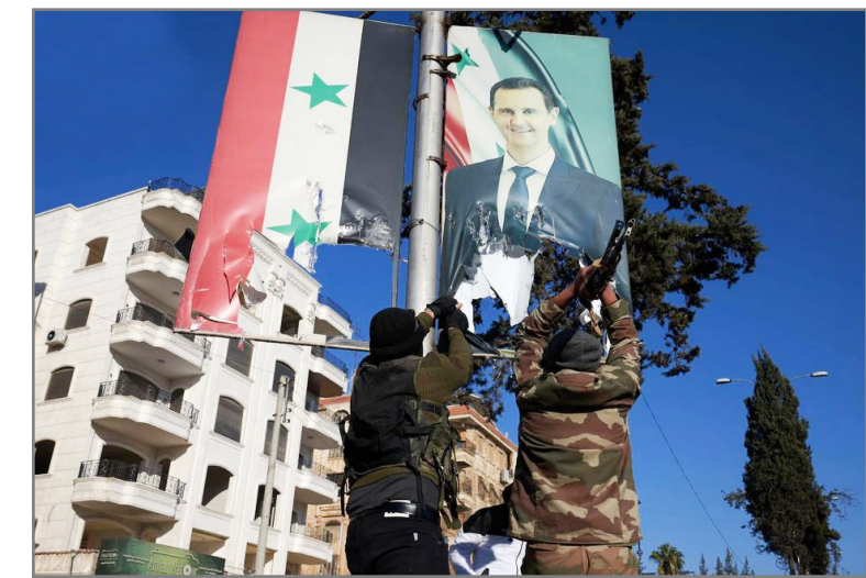
تعمال سازنده یا سازمان ملل متحد در این زمینه ادامه می‌دهد.

توان حل مشکلات و چالش‌های سنگین کشور را نداشت به همین خاطر دست به دامن احمد قوام‌السلطنه دیگر کهنه‌سیاستمدار عصر پدش و انتصاب به عنوان نخست‌وزیر شد. قوام‌السلطنه از یک سو سومین نخست‌وزیر شاه جوان بود و از سوی دیگر سومین دوره صدارتش در دوره پهلوی‌ها را تجربه کرد.